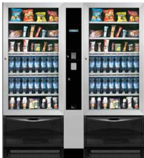
VISTA L + MODULO MASTER + VISTA L