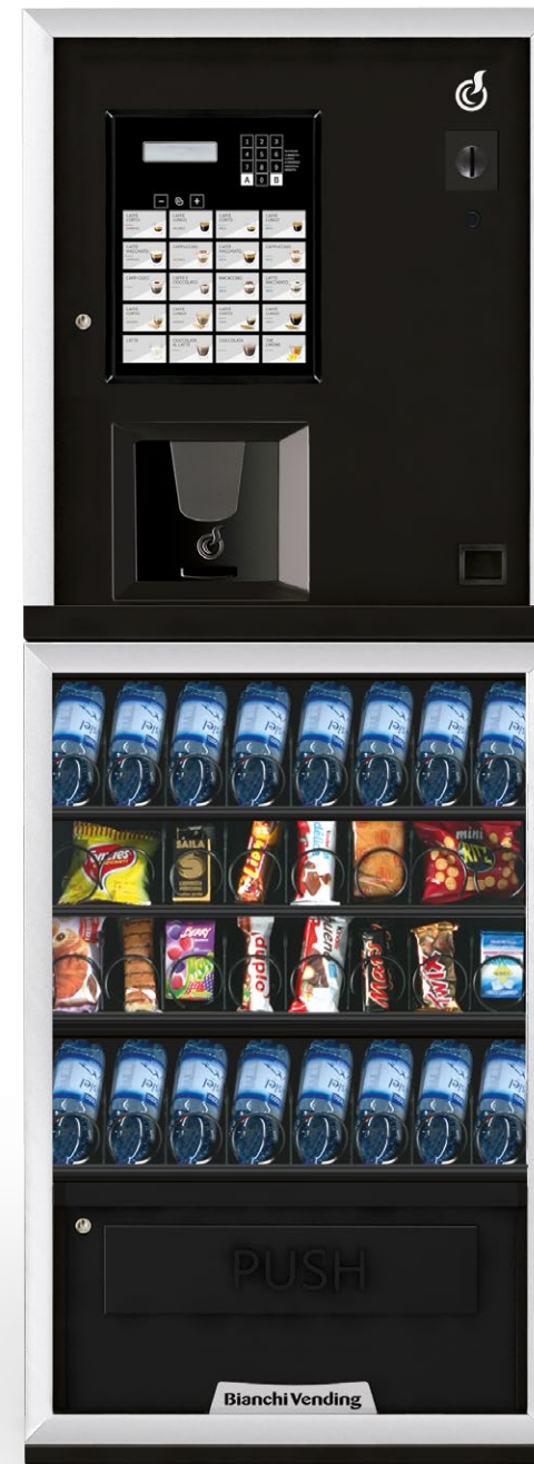
LEI300 SMART + ARIA S SLAVE