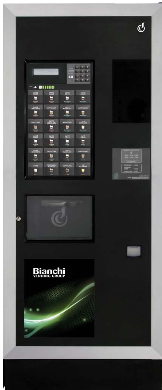
LEI 500 M TASTIERA CAPACITIVA (STT)

LEI 500 M, IL NUOVO VENDING DESIGN CONCEPT CHE OFFRE MODULARITÀ, FLESSIBILITÀ E COMUNICABILITÀ.