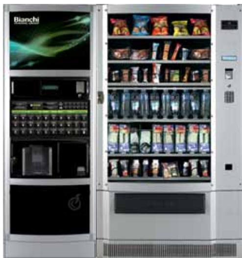
LEI 700 + BVM 695 3°