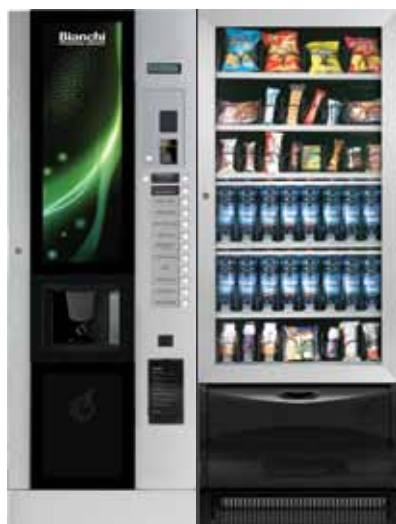
LEI 600 PP + VISTA L