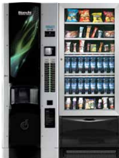
BVM 972 + VISTA L