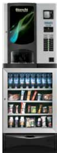
BVM 931 + VISTA S